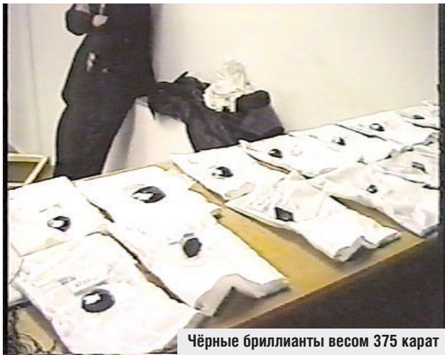
Чёрные бриллианты весом 375 карат

С ним оперативники и направились в Луков переулок, где располагался банк. Его сотрудники вынуждены были подчиниться и предоставили