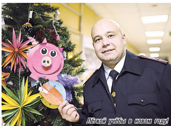
Лёгкой учёбы в новом году!

Нужно будет получить сведения о судимости (или её отсутствии) близких родственников. Если судимость подтвердится,