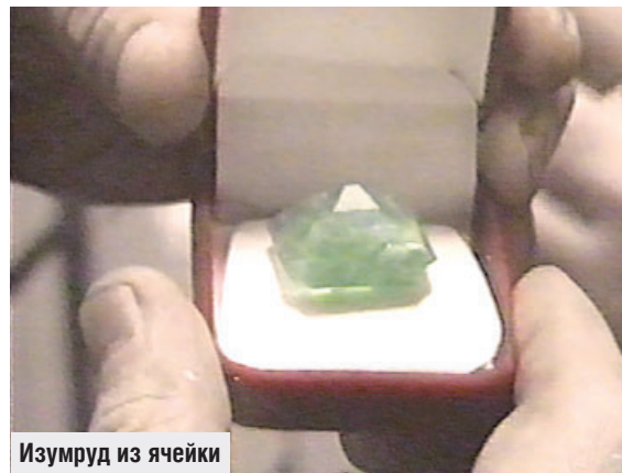
Изумруд из ячейки