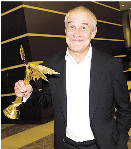
О ролях, буднях актёрской жизни и о своей мечте рассказал известный актёр, заслуженный и народный артист России Сергей ГАРМАШ.