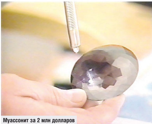
Муассонит за 2 млн долларов

все имевшиеся ключи. За заветными дверцами покоилась очередная партия сокровищ: 600 высококачественных изумрудов, векселя на десятки и сотни миллионов рублей.