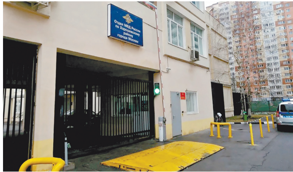
ОМВД России по Хорошёвскому району

И все они, соратники по оперативной работе, испытывают профессиональное удовлетворение, когда раскрывают очередное преступление.