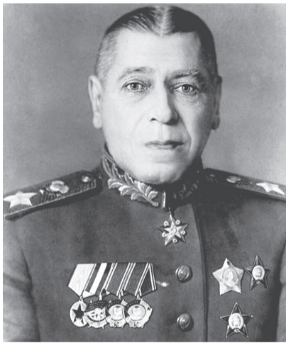
Борис Михайлович Шапошников