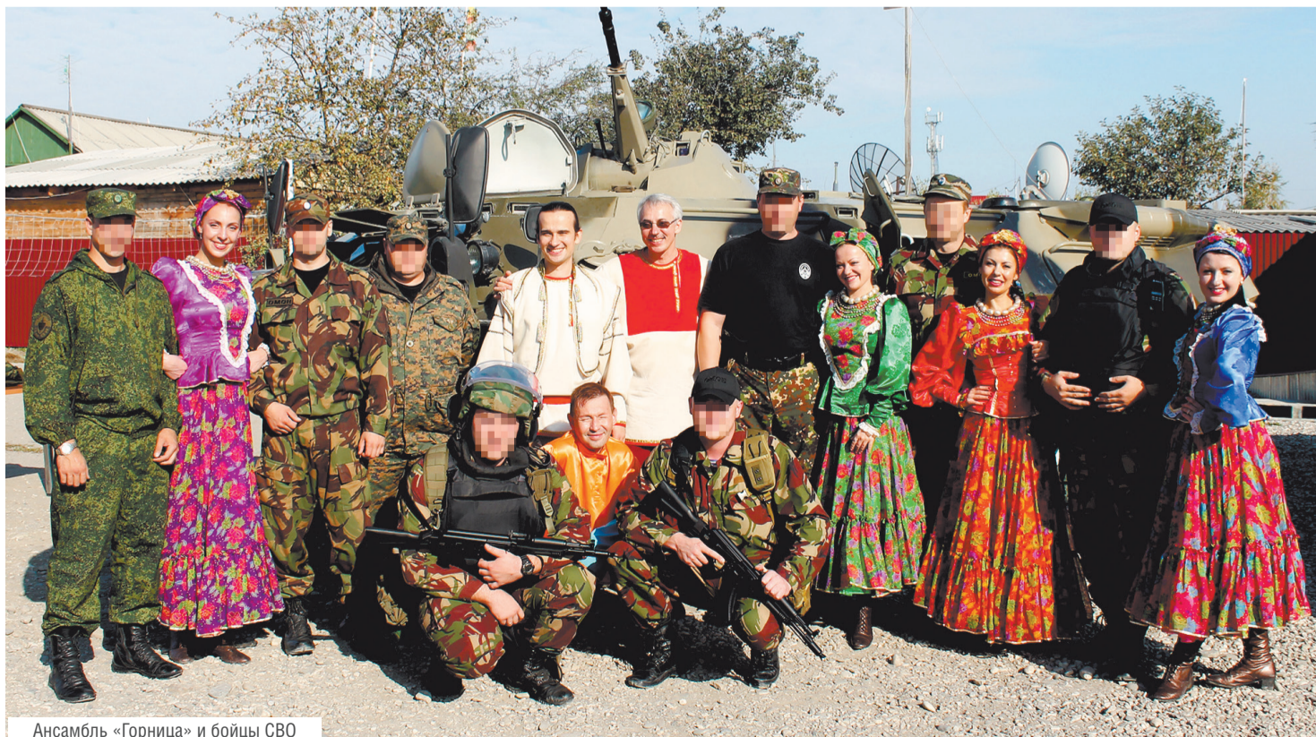
Ансамбль «Горница» и бойцы СВО

— Наш коллектив уже давно сформирован, и все сотрудники работают как единый организм. Поскольку направлений много, — от концертного отдела до культурно-просветительской работы — каждый сотрудник способен выручить коллегу и оказать содействие. Мы принимаем участие во всём и везде. Например, ансамбль «Горница» выступает в рамках встреч с иностран-