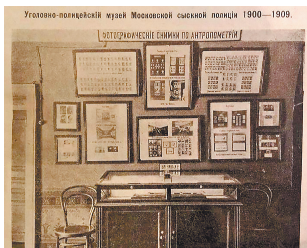
Уголовно-полицейский музей Московской сыскальной полиции. 1900—1909 годы

Согласно изданному Административным отделом Моссовета приказу № 159 от 11 апреля 1925 года, при подотделе уголовного розыска АОМС (так в тот период официально именовался МУР) открыли музей. Тем же приказом был установлен порядок