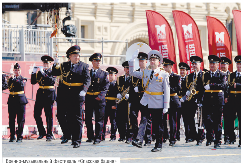
Военно-музыкальный фестиваль «Спаская башня»

ми делегациями, выезжает в госпитали для поддержки бойцов специальной военной операции. Мы присутствуем на мероприятиях в детских оздоровительных лагерях, выезжаем по заявкам в подразделения системы главка. Также организуем культурные мероприятия различной тематики. Из недавних — у нас в центре прошёл концерт, посвящённый Международному женскому дню. На таких мероприятиях выступают не только наши солисты, но и сотрудники полиции гарнизона, которые участвуют в художественной самодеятельности, а так-