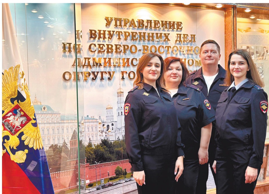
Александров с коллегами

Жильцы одной из квартир в Марьиной Роще написали заявление, что «сотрудники полиции собираются отжать у пожилой женщины её квартиру». Ситуация, прямо сказать, скандальная. Инспекция начала проверку и выяснилась совсем иная картина. Оказалось, это те самые жильцы, «пожалевшие» бабушку,