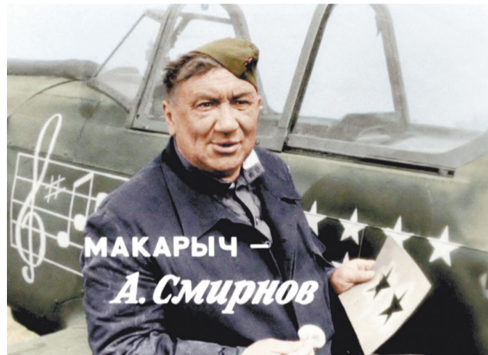
Кадр из фильма «В бой идут одни старики»

Памяти псковских десантников посвящены фильмы «Честь имею», «Прорыв», «Русская жертва», мюзикл «Воины духа», книги «Рота», «Прорыв», «Шаг в бессмертие», песни. В их честь названы улицы родных городов, в учебных заведениях, где учились герои-десантники, установлены памятные доски. Им поставлены памятники в Москве и Пскове.