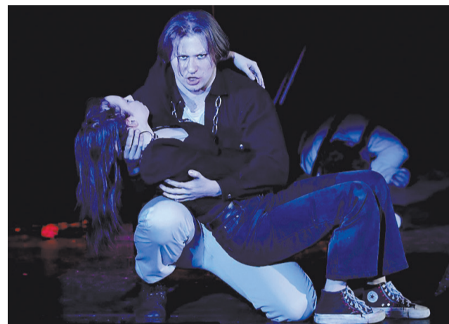
«Ромео и Джульетта»

Диалоги Ромео и Джульетты, исполняемые артистами на разных национальных языках, их образы не давали никому в зале оставаться безучастными. Не смотря на трагичное завершение сюжета, спектакль пробуждал позитивные чувства, поскольку открывал всем несокрушимость любви. Об этом, в частности, после представления говорил со сцены народный артист России Вячеслав Спесивцев.