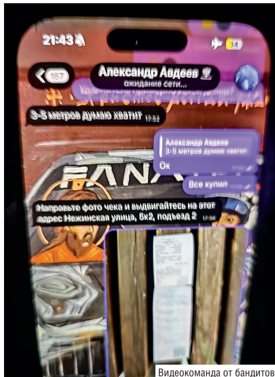
Видеокomанда от бандитов