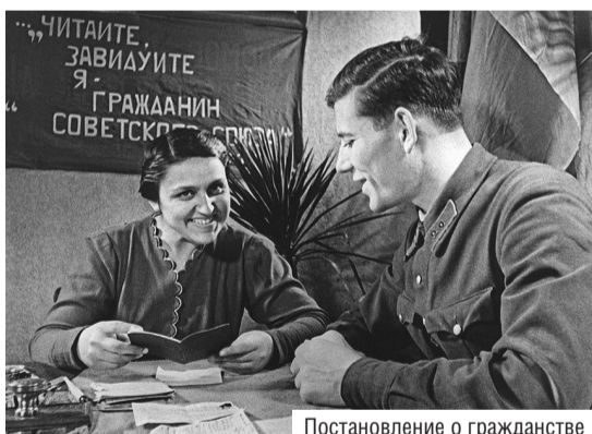
Постановление о гражданстве